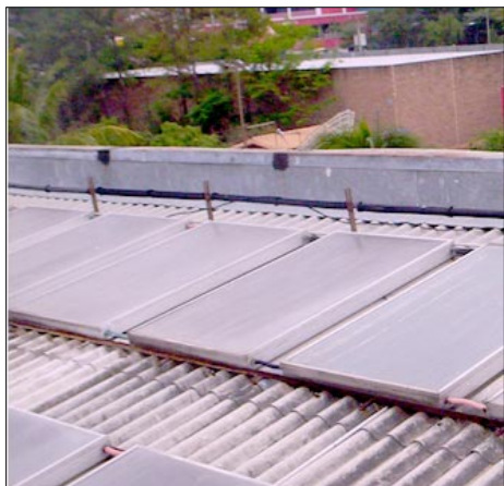
Paneles solares en el Hotel Terraza

Ley de Incentivos Fiscales para el Fomento de las Energías Renovables para la Generación de Electricidad, aunque en sus Considerandos afirma que “es necesario promover con políticas activas del Estado el incremento de uso de las fuentes renovables de energía, a efecto de disminuir la dependencia en la compra de combustibles fósiles” y que “la utilización de fuentes renovables de energía para la generación eléctrica contribuirá a disminuir la contaminación ambiental en el país y mejorará significativamente la balanza de pagos nacional”, lo cierto es que dicha ley está destinada a las empresas que puedan generar suficiente energía para una ciudad como San Salvador, y no ofrece ningún incentivo para las instalaciones caseras, como se hace en Honduras y Nicaragua. En la ley mencionada hay Exención de Derechos Arancelarios para proyectos hasta de 20 megavatios, y Exención de pago de Impuesto sobre la Renta por un periodo de cinco años para proyectos de 10 y 20 megavatios y de diez años para proyectos de menos de 10 megavatios. Una casa solo necesita 3 kilovatios.